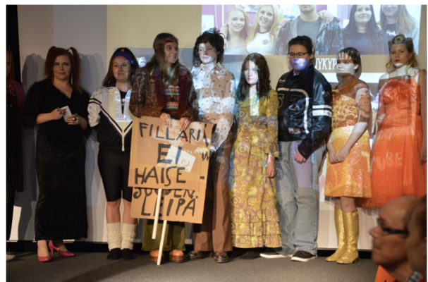
Kuva: Pro-testi 70 vuotta nuorisotyötä Valkeakoskella muotinäytös.

PRO-TESTI 70 VUOTTA NUORISOTYÖTÄ VALKEAKOSKELLA