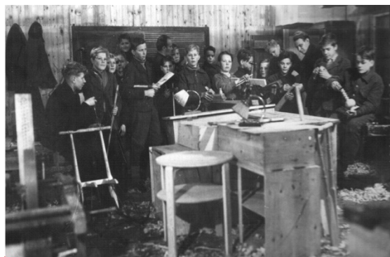
1947 poikien askartelupaja

Tiivistetty historiikki nuorisotyöntekijöiden ja tilojen sekä toiminnankin näkökulmasta löytyy toimintakertomuksen lopusta.