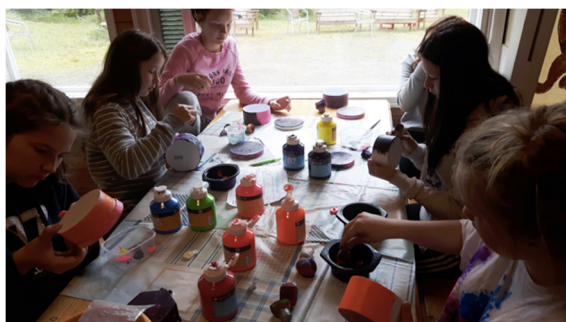
Tytöt askartelevat 2016 kesäleirillä